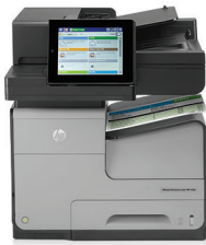
Impresora multifuncional HP Officejet Enterprise Color X585dn

La revolución en impresión para su empresa. Las impresoras multifuncionales HP Officejet ofrecen impresiones en color a hasta el doble de velocidad y la mitad del coste por página que las láser en color, además de copia, escaneo y fax 1,2,3 . Están diseñadas para el flujo de trabajo avanzado y construidas para durar.