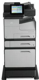
Impresora multifuncional HP Officejet Enterprise Color Flow X585z con bandeja de papel y armario/soporte opcionales