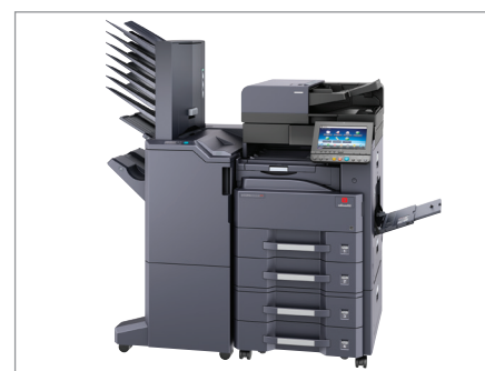
d-Copia 3502MFplus con la máxima configuración