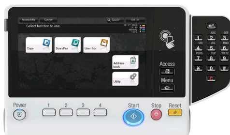
Innovadora pantalla multitáctil de 7" con área de autenticación NFC y teclado opcional (KP-101)